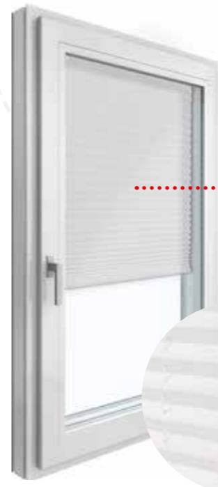
KV 440 intérieur PVC | PVC blanc

Le revêtement en aluminium de ces stores à double plissé est pratiquement imperméable à la lumière, ce qui garantit un obscurcissement parfait. Le Duette® vous assure également une excellente protection contre les regards indiscrets, indispensable dans la salle de bains comme le dressing.