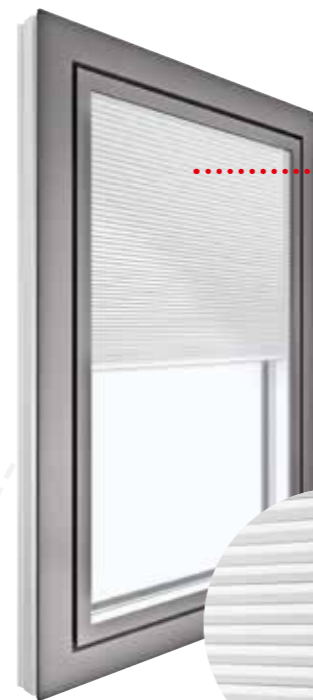
KV 350 extérieur Coque alu | HM907